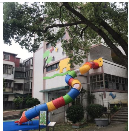
門口圓環地坪改善與溜滑梯建置